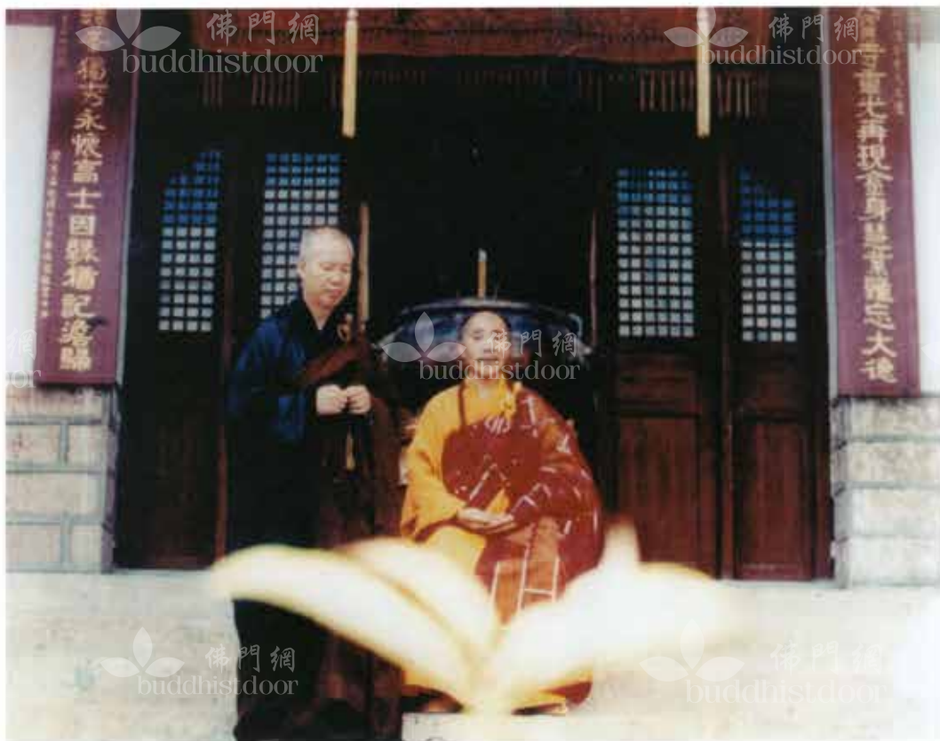
1984年八月十三日於丹霞山別傳寺接本煥老和尚法