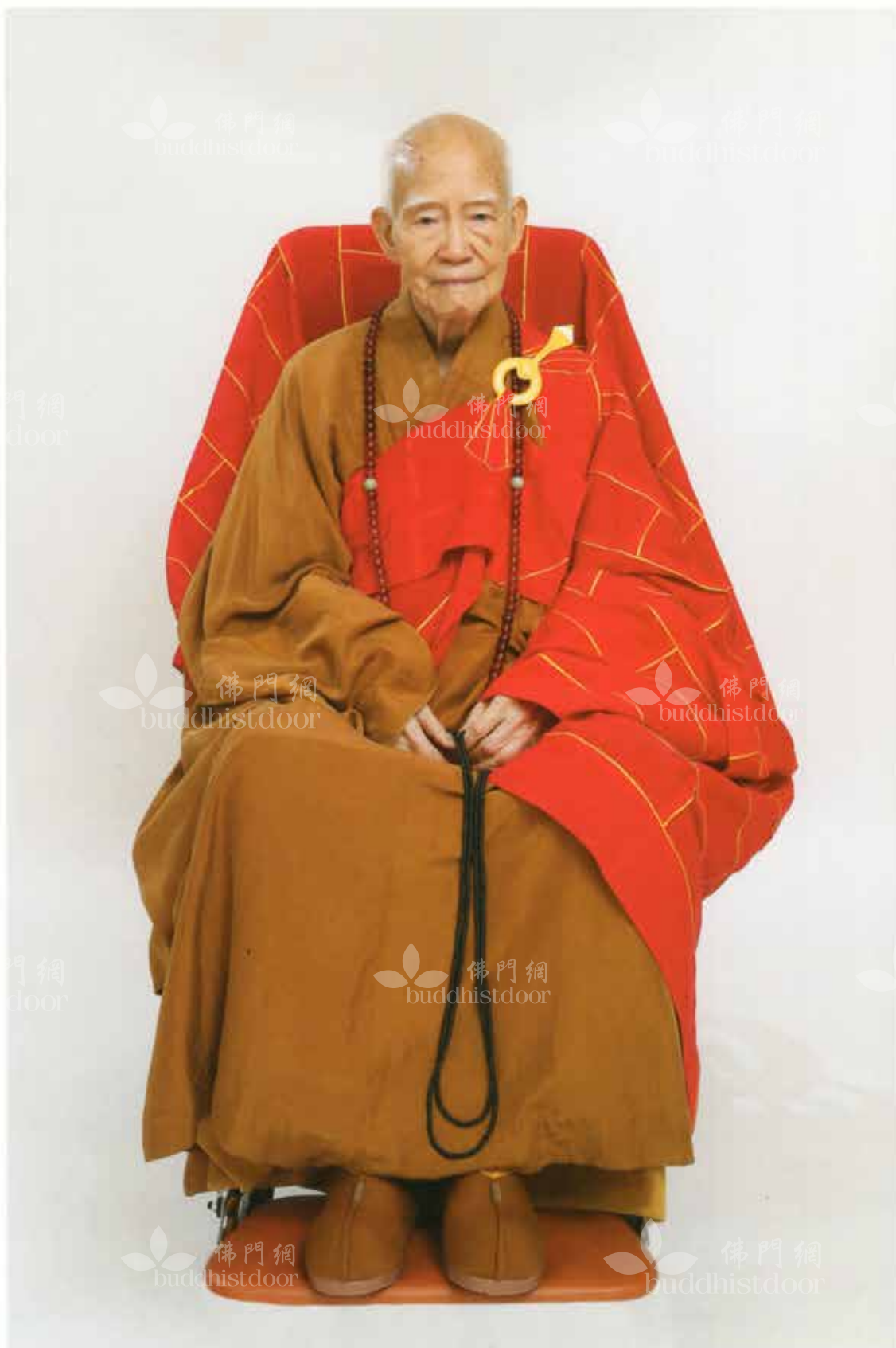
2016年5月1日攝於鑽石山志蓮淨苑