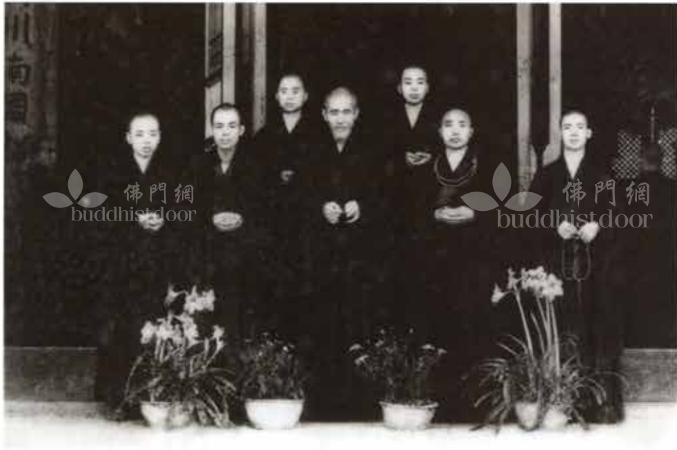
1949 年於曹溪南華寺戒期圓滿