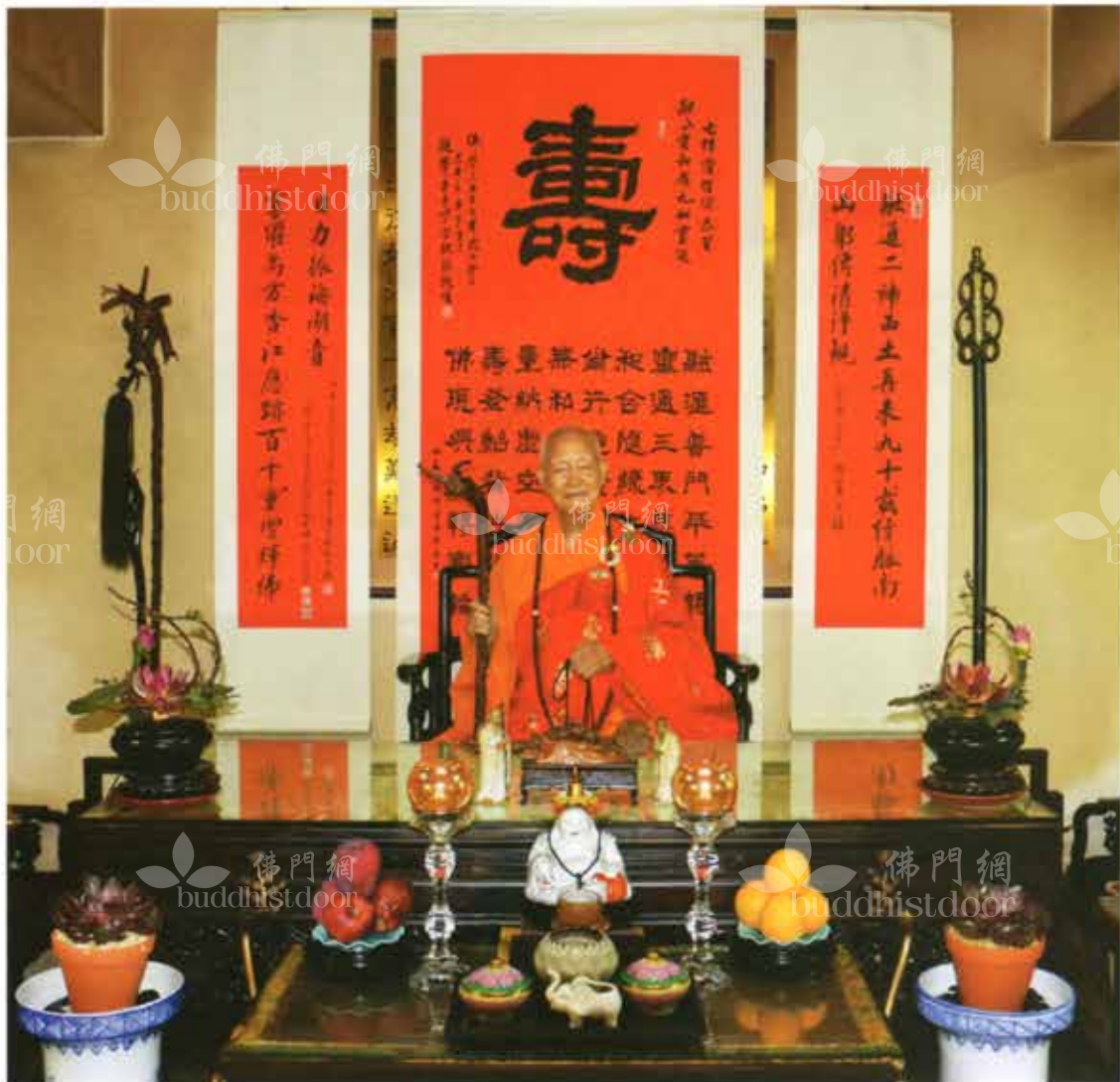
2013年六月二十六日師九十嵩壽於觀音寺丈室