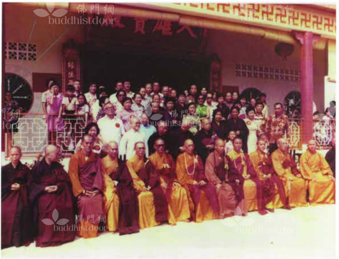
1978年馬來西亞妙緣蓮社開光典禮