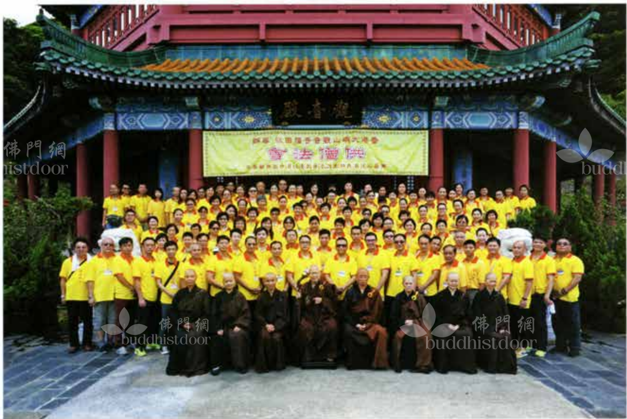
2015年七月十五佛歡喜日觀音寺福田組供僧法會